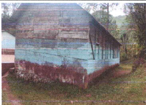
Foto 5: Parte posterior de Modulo II paredes con humedad por lluvia.