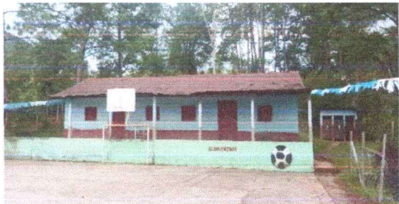
Foto1: Panorámica techo de modulo II deterioradas.