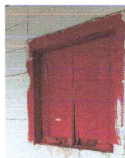
Foto: Ventana de madera deteriorada.

Observación: Si es necesario se pueden agregar hojas adicionales y actualizar el número de hojas.